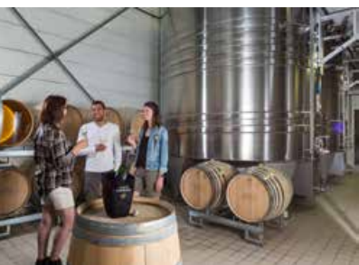
Visite de caves et dégustations (à partir de 7 € / pers.)