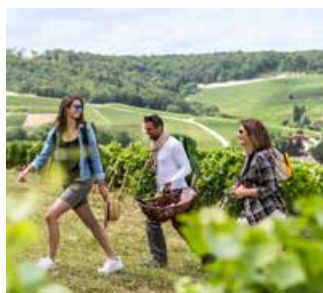
Balades guidées dans les vignes